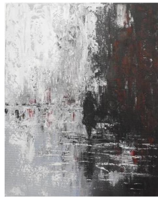
Samotność , akryl, 2023