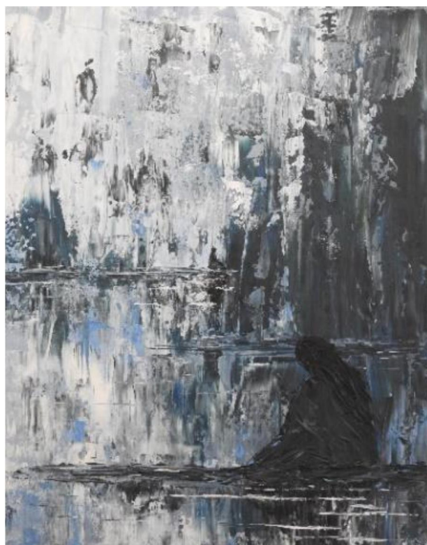
Zima , akryl, 2023