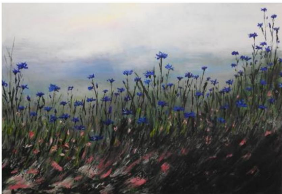
Chabry , akryl, 2024