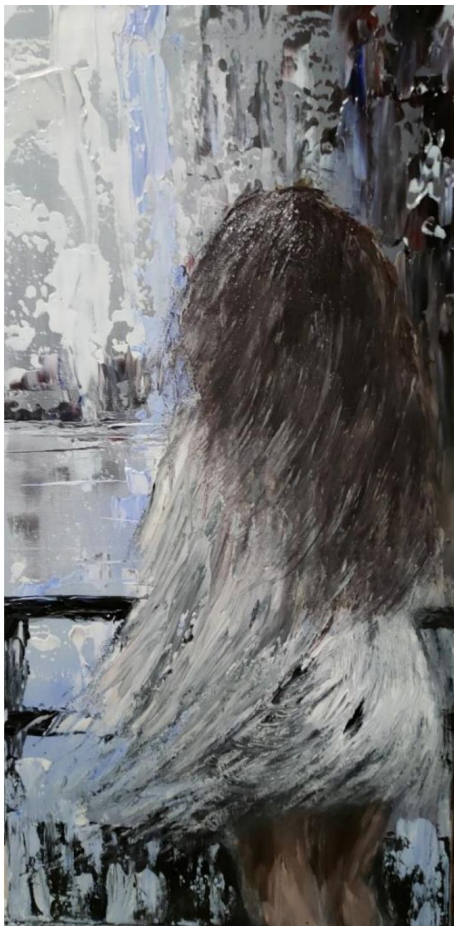
Fascynacja , akryl, 2023

Nieobcy jest jej również batik, bowiem w 2023 r. uzyskała certyfikat instruktora z tej dziedziny sztuki.