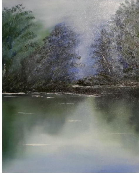
Barwy wody , hydr - oil, 2024

Pracę zawodową rozpoczęła jako kierownik Miejskiej i Powiatowej Biblioteki Publicznej w Drawsku Pomorskim. Od ponad 10. lat jest pracownikiem dydaktycznym Gminnego Ośrodka Kultury w Janowie Podlaskim. Od 2018 roku jest również dyrektorem tej instytucji.